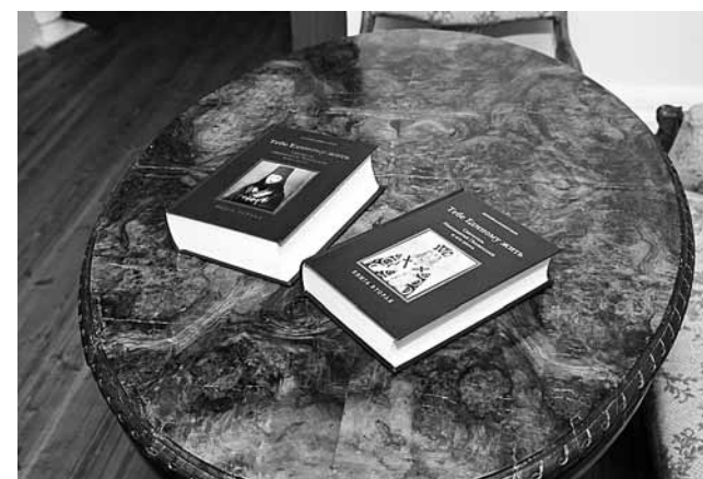
Двухтомник «Тебе Единому жить»

– Сразу же после его кончины. Но массовый характер почитание приняло, насколько можно судить, в 1854 году, через 35 лет после его кончины. Когда в усыпальни-