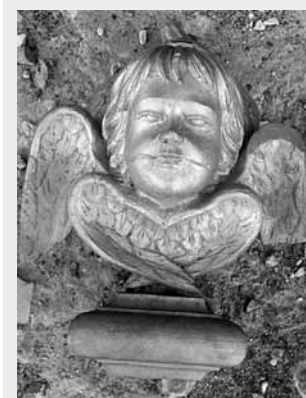
Тот самый шестикрылый серафим

В 2008 году решением местной власти музей, созданный моими родителями, был закрыт.