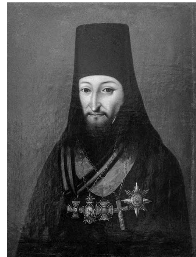
Единственный прижизненный портрет святителя Иннокентия Пензенского

це Спасского кафедрального собора хоронили упокоившегося епископа Пензенского и Саранского Амвросия II, обнаружилось, что мощи владыки Иннокентия нетленны. Православные стали приносить ему молитвы, как к небесному заступнику. Было собрано много свидетельств об исцелениях и других чудесах на могиле святителя.