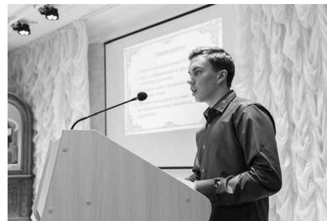
Защита конкурсных работ 2018 г.

Что удивительно, Стяжино – почти вымершее село – с началом строительства храма стало обретать вторую жизнь. Подтянулись местные уроженцы, активно жертвующие на строительство новой церкви, стали обустривать давно заброшенные земельные участки, где когда-то стояли их дома.