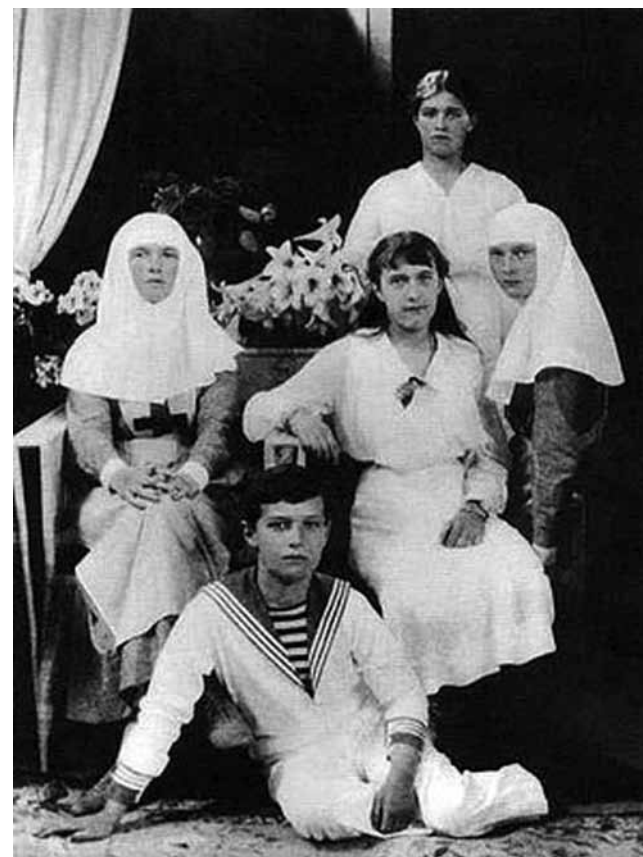
С сестрами Ольгой, Татьяной, Марией и Анастасией

Государь император делал очень многое для воспитания в сыне внимания и сострадания к людям. П. Жильяр описывает следующий случай: «На возвратном пути, узнав от генерала Иванова, что неподалеку находится передовой перевязочный пункт, Государь решил прямо проехать туда. Мы въехали в густой лес и вскоре заметили небольшое здание, слабо освещенное красным светом факелов. Государь, сопровождаемый Алексеем Николаевичем, вошел в дом, подходил ко всем раненым и с большой добротой с ними беседовал. Его внезапное посещение в столь поздний час и так близко от линии фронта вызвало изумление, выражавшееся на всех лицах».