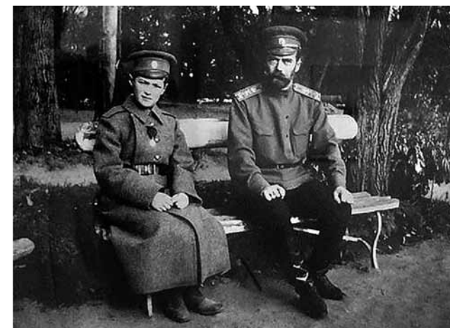
С отцом - государем Николаем II

Один из солдат, которого только что вновь уложили в постель после перевязки, пристально смотрел на государя, и, когда последний нагнулся над ним, он приподнял единственную свою здоровую руку, чтобы дотронуться до его одежды и убедиться, что перед ним действительно царь, а не видение. Алексей Николаевич стоял немного позади своего отца. Он был глубоко потрясен стонами, которые он слышал, и страданиями, которые угадывал вокруг себя».