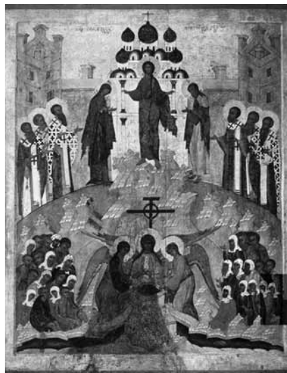
Происхождение (изнесение) Честных Древ Животворящего Креста Господня

Дело в том, что в столице Византии, Константинополе (Царьграде), в связи с частыми в августе болезнями, существовал обычай носить крест по улицам и дорогам в надежде преградить путь невидимо крадущейся пагубе. Накануне праздника драгоценный крест, включавший в себя сохранившиеся частицы дерева Голгофского Креста, торжественно переносили из царской сокровищницы в главный собор Империи – храм Святой Софии Константинопольской, и полагали на престоле. С этого дня и до Успения Богородицы, в течение двух недель, по всем улицам города проносили крест в процессии, а затем вновь возвращали в императорские палаты.