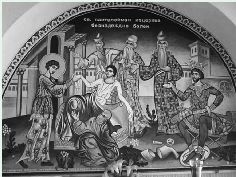
Святой Пантелеимон исцеляет безнадежно больного

Память св. вмч. Пантелеимона совершается Православной Церковью 9 августа.