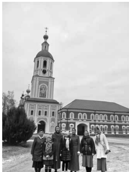
В Санаксарском монастыре Рождества Богородицы.

На Шихан-горе в древности был Покровский женский монастырь, стоял величественный десятиглавый Троицкий собор, это было исторически значимое место. К сожалению, от былого величия обители ничего не сохранилось – в советские времена монастырь был разрушен, и только спустя многие годы было принято решение восстановить обитель. Сейчас там пока только заложен фундамент и построены два храма: Сергия Радонежского, где регулярно совершаются богослужения, и недавно освященный каменный храм Покрова Пресвятой Богородицы. Место само по себе очень благодатное, уединенное, там очень красивая природа, стоят вековые сосны, воздух чистый... Еще рядом находится село Ахматовка, где стоит древний храм в честь Казанской иконы Божией Матери. Построен он был в XVIII веке. Там тоже собрано много удивительных святынь,