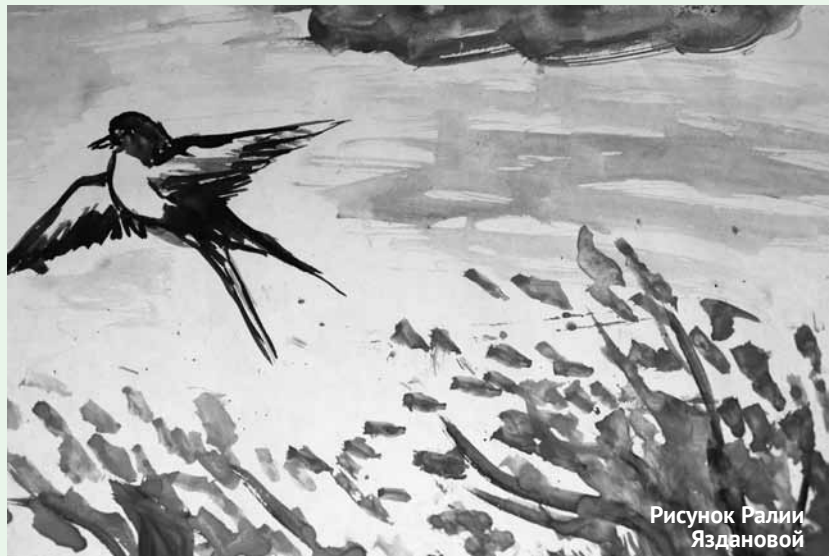
Рисунок Ралии Яздановой

повести новым путем, в теплые края, в Царство Божие, «идеже несть болезнь, ни печаль, ни воздыхание». Но и в малом, человеческом теле великий Господь оставался Сущим, Неизменным, Вечным. Всегда таким, каким Он был от века в беспредельности Царства Своего и неизреченной Своей славе.