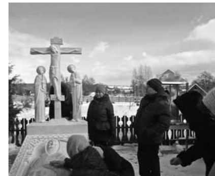
На могиле старицы Сепфоры. Пустынь Спаса Нерукотворного в Клыково Калужской области

Все они разные, но схожи в одном: после поездки они возвращаются не только наполненными светлыми и радостными впечатлениями, но и внутренне преобразившись, пусть каждый и в разной степени. И рассказывают друзьям и знакомым о безотчетном чувстве радости, ощущении душевной легкости, какое бывает, когда удается отвлечься от повседневной суеты и хоть немно-