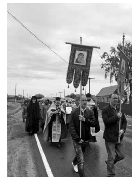
Крестный ход в Соловцовку