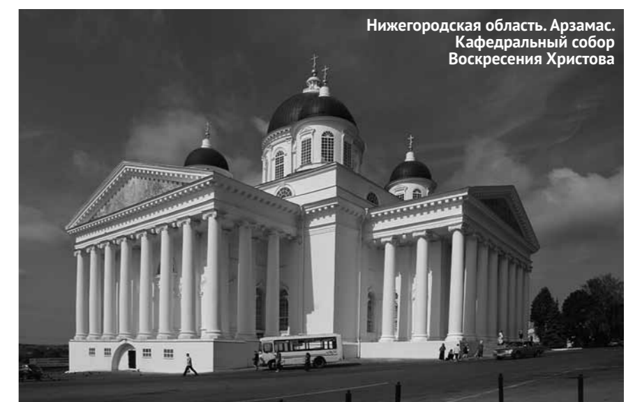
Нижегородская область. Арзамас. Кафедральный собор Воскресения Христова

Справки по телефонам: 8-927-375-3165, 8-927-375-6061, 25-31-65, 25-60-61. Адрес: г. Пенза, Советская площадь, 1