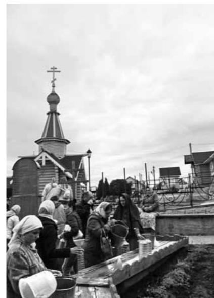
У источника преподобного Серафима Саровского

– Мы строим поездки так, чтобы люди обязательно попали на богослужение, могли помолиться у святынь, приложиться к ним. Но и свободное время оставляем. По желанию паломники могут посетить близлежащие достопримечательности, мы в этих случаях заранее обговариваем время и место встречи, потом собираемся и едем обратно, – поясняет отец Михаил.