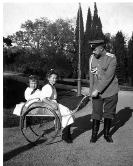
Великие княжны Мария и Анастасия и Евгений Сергеевич Боткин

Служение медика Евгений Сергеевич считал истинно христианским делом, он имел религиозный взгляд на болезни, видел их