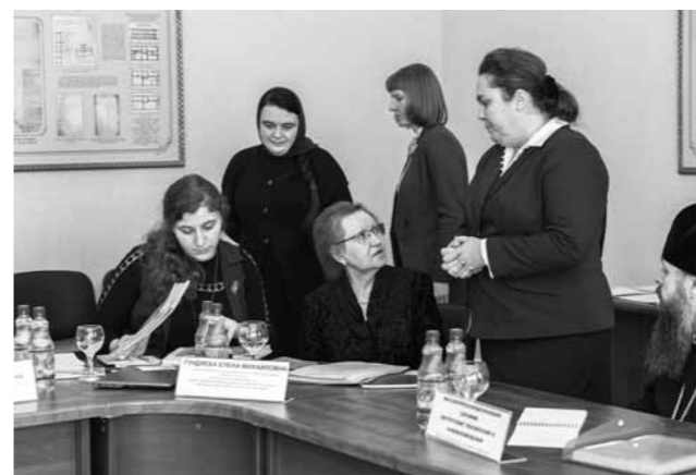
Рабочий момент совещания

подготовки служителей Русской Православной Церкви, специальность «Регент церковного хора, преподаватель», разработанный Учебным комитетом Русской Православной Церкви на основе опыта регентского отделения Санкт-Петербургской духовной академии. С 2017 года апробация стандарта началась на базе Пензенской, Екатеринбургской, Кузбасской и Самарской духовных семинарий. Состоявшийся в пензенской ду-