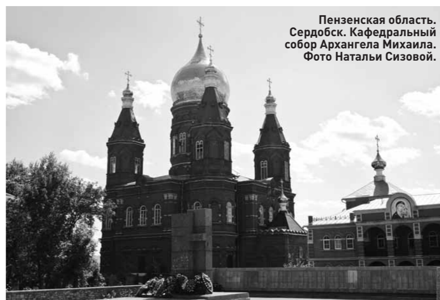
Пензенская область. Сердобск. Кафедральный собор Архангела Михаила.