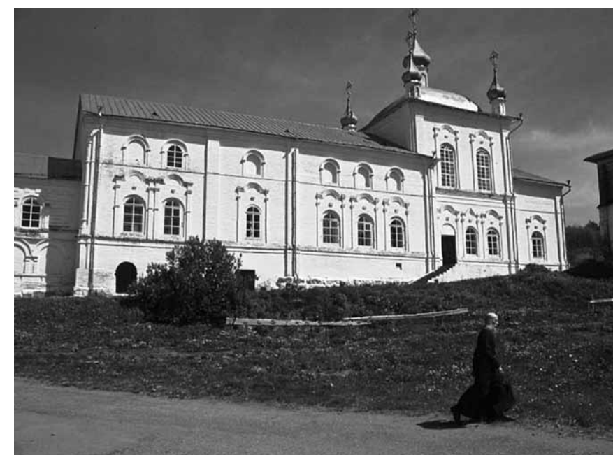
Пензенская область. Вадинск. Керенский Тихвинский монастырь

20 августа. Пензенская область. Сердобск: Михаило-Архангельский кафедральный собор. Сердоб-