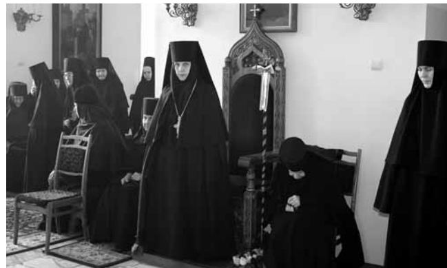
Игумения с насельницами Троице-Сканова монастыря

Насельницы рассказали, что живут, в основном, своими трудами. Несут послушания в трапезной, в прощфорне, в швейной, в ризнице, на скотном дворе. Уже тогда в монастыре было большое хозяйство: послушни-