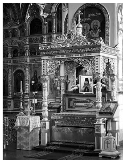
Рака с мощами святителя Иннокентия в Успенском соборе