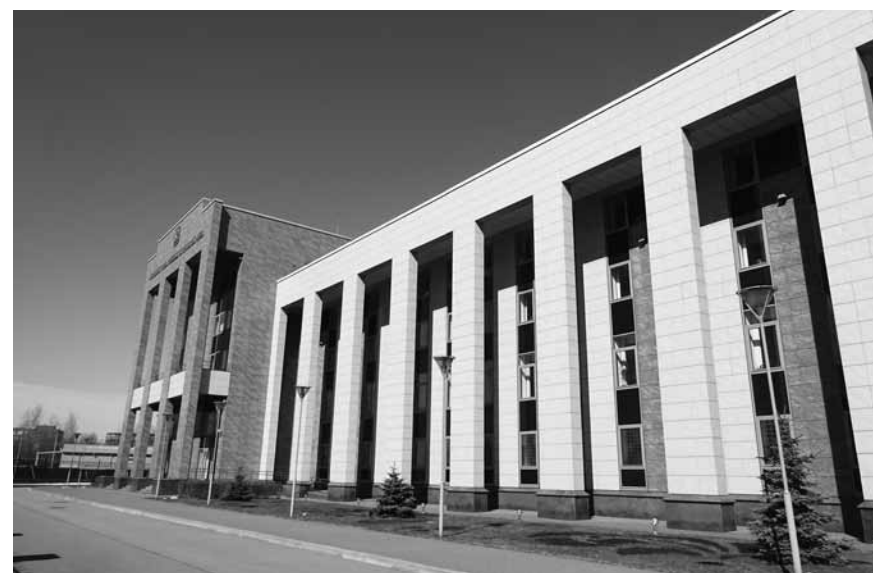
Российский государственный исторический архив. Санкт-Петербург