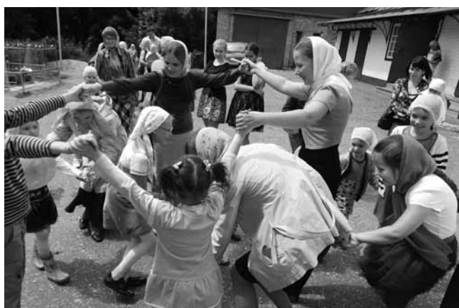
Среди прихожан очень много детей и подростков