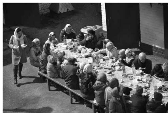
Праздники отмечают всем приходом

Лариса ТУЗАЕВА, фото Екатерины НЕВОЛИНОЙ.