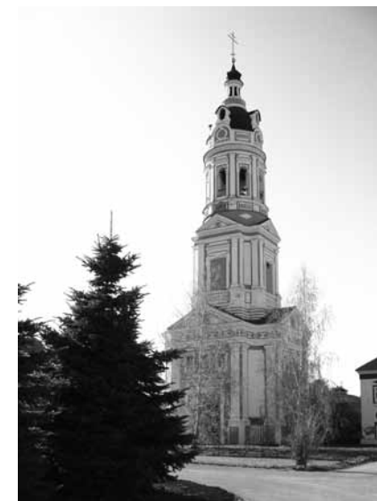
Троице-Сканов монастырь. Наровчатский район.

31 мая. Пензенская область. Пензенский район. Соловцовка: Троице-Сергиев храм, к мощам священноисповедника Иоанна Оленевского. Крестный ход в село Оленевку к келье священноисповедника Иоанна Оленевского (31 мая – день обретения мощей и прославления святого).