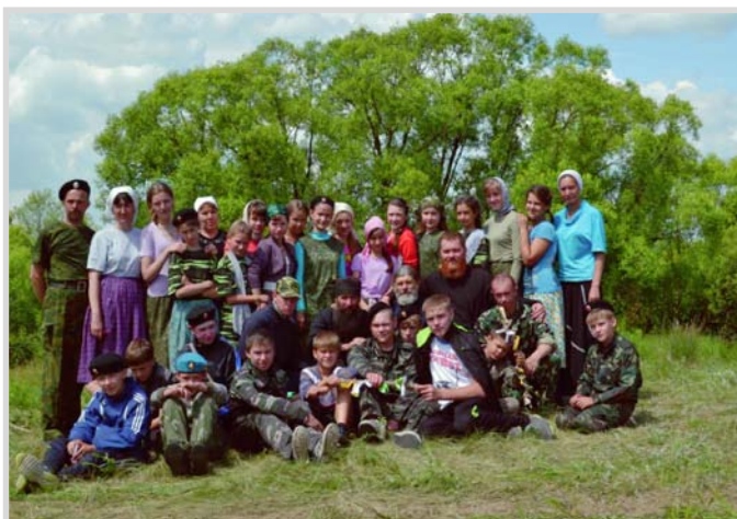
В летнем лагере воспитанников воскресных школ закончилась летняя смена