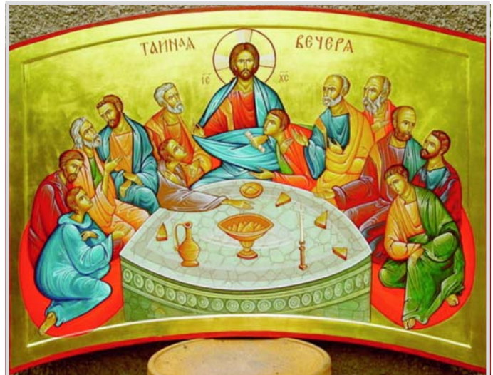
Тайная вечеря. Икона XIX века

Ты создал себе свои планы и принёс их ко Мне, чтобы Я благословил их.