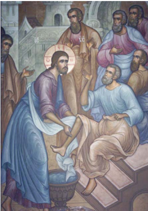
Христос умывает ноги Своим ученикам. Икона XIX века

Всё послано Мною для совершенствования души твоей, - ОТ МЕНЯ ЭТО БЫЛО.