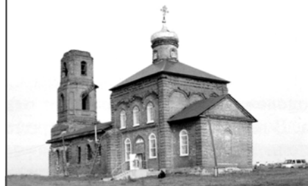
Успенская церковь села Елизаветино Мокшанского района

Десять лет назад жители села, в котором проживает более тысячи человек, решили всем миром восстановить старинный храм в честь Успения Божией Матери. В 2012 году ему исполнилось 150 лет, и к этому времени храм, в котором прежде размещалось зернохранилище, пришёл в ветхость, обветшала кирпичная кладка, стёрлись росписи со стен, сгнили полы... Но силами верующих людей и благотворителей реставрация старинного храма идёт: большая часть крыши покрыта железом, отреставрирован крест храма, само помещение приведено в порядок, иконы, спасённые прихожанами в 30-х годах, вернулись на свои места, .