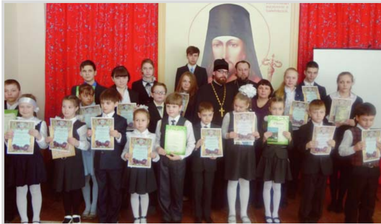
Награждение победителей творческого конкурса в православной гимназии Пензы

Детям была предложена примерная тематика работ, например, "Первая печатная книга Ивана Федорова "Апостол", "И было слово дивного начало...", "Слово русское, родное", "Страницы духовного чтения", "Русский язык и русский национальный характер", "Православная книга - первая книга на Руси", "Книги добра и любви", "Духовных книг Божественная мудрость", "От бересты - до первой книги". Также работы детей могли посвящаться различным сторонам православной жизни, изучению Закона Божия, истории Церкви, семейным