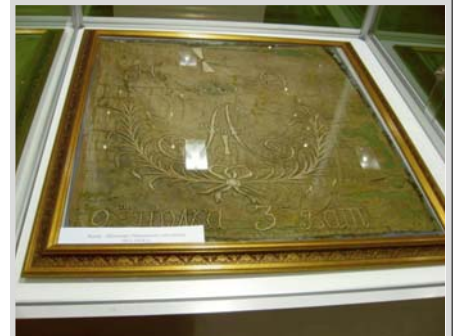
Один из штандартов пензенского ополчения 1812-1814 гг.

Наши делегаты брали с собой литературу о пензенских святынях, истории края, житийную литературу и акафисты святым Земли Пензенской, общецерковный православный календарь на 2013 год, изданный специально для Пензенской митропо-