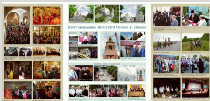
Часть экспозиции Пензенской митрополии на выставке