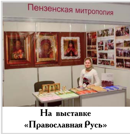
На выставке «Православная Русь»

Что же привезли с собой в Пензу представители Союза православной молодёжи? Радость молитвенного общения, новые добрые знакомства, множество положительных эмоций и воодушевление от концентрированного ощущения себя частью Православной Руси.