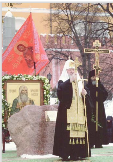
Святейший Патриарх Московский и всея Руси Кирилл совершил молебен и освятил закладной камень на месте памятника священномученику Ермогену. 3 марта 2012 года

настырю направились соединённые русские и польские рати. Самозванец в страхе бежал вместе с Мнишек в Калугу. А в 1611 году Угреша стала