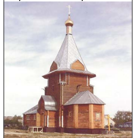
Новопостроенный Никольский храм в с. Малая Сердоба. Построен в 2010 году