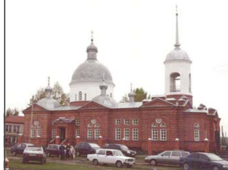
Никольский храм села Поим Белинского района. Восстанавливался 15 лет. Освящён архиерейским чином в 2010 году

Храни язык, ибо он часто приносит то, чего ты не хочешь, имей в памяти непрестанно молитву Иисусову, она искореняет злые помыслы. Тщательно наблюдай за всеми своими мыслями, словами и делами. Вечером рассматривай грехи, которые сделал за день, и вообрази, как много нераскаянных грешников в этот день сошли в ад. Благодарю Бога, что Он даёт тебе ещё время на покаяние. Не откладывай покаяния до завтра, до другого дня: неизвестно, доживёшь ли ты до того дня. Нет ничего противнее благочестию, как откладывать своё покаяние. Исповедуйся как можно чаще, каждый раз, когда бываешь в церкви. Ежедневно мы грешим, ежедневно надо и каяться, когда, где и как позволяют условия. Если в церковь не можешь пойти, значит, кайся дома перед крестиком. Грехи же за определённый период напиши отцу духовному. Если не будешь каяться ежедневно, то грехи забудутся и останутся нераскаянными.