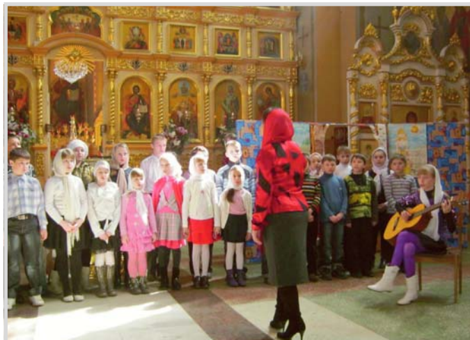
Светлое Христово Воскресение. Пасха. Праздничное выступление в Вознесенском кафедральном соборе

Но разве можем мы сказать взрослым уже ребятам и девушкам: всё, вы уже закончили курс, до свиданья! Это всё равно, что выгнать едва вставшего на ноги малыша на улицу, на все четыре стороны! Да, они встали на ноги, закончили курс, но мир, в котором они живут, который окружает их ежедневно, во зле лежит, и если есть у них