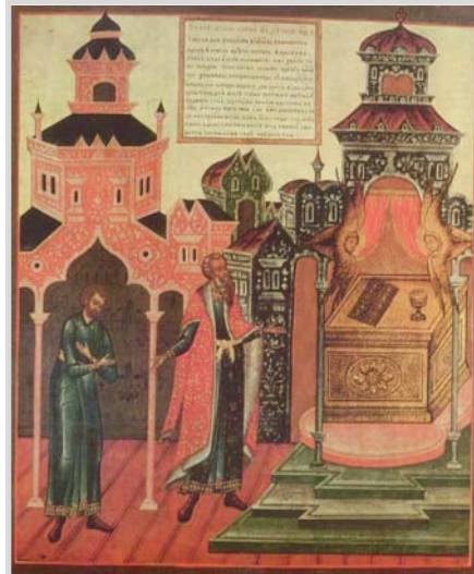
Притча о мытаре и фарисее. Икона XVII в.

... На всенощной Недели о мытаре и фарисее в храме гаснет свет и начинается пение покаянных тропарей - "Покаяния отверзи мне двери..." - молитва о даровании покаяния. На воскресной литургии читается Евангелие от Луки (18, 10-14) - притча о мытаре и фарисее, рассказанная Спасителем своим ученикам. Эта притча напоминает нам, что главная добродетель христианина - смирение, то есть умение видеть недостатки прежде всего в самом себе и желание очиститься от них с помощью Божией. Поэтому мы, право-