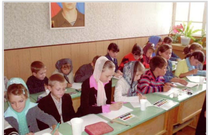
На занятиях в воскресной школе

Соответственно, вырос и педагогический коллектив воскресной школы, теперь здесь с ребятнёй занимают-