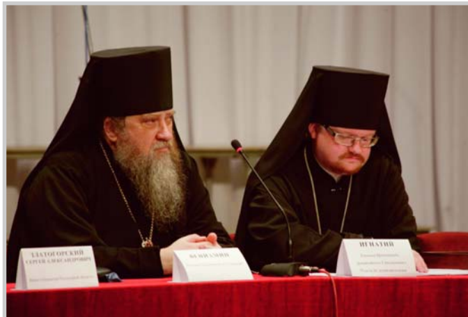
В президиуме форума - Преосвященный Вениамин, епископ Пензенский и Кузнецкий, и Преосвященный Игнатий, епископ Бронницкий, руководитель Синодального молодежного отдела

- Я очень рад тому, что на Пензенской земле уже второй раз проходит по благословению Преосвященного Вениамина, епископа Пензенского и Кузнецкого, такое важное собрание - форум православной молодежи. Форум позволяет молодым людям, собравшись вместе, подумать над тем, как жить, каким путём идти, что мы оставим своим детям и внукам, чем мы можем гордиться, к каким истокам нам обращаться. Сегодня мир настолько погружается в атмосферу разделения, что порой даже в одной семье бывает очень тяжело называть брата или сестру родственными душами. Эти модели, разделяющие человеческое общество, через телевидение, Интернет, другие средства массовой информации пытаются перенести на нашу исконно православную русскую землю, которая полита кровью наших предков. Нас заставляют жить по правилам мира, который уже доказал свою несостоятельность. Посещая страны Западной Европы, удивляешься, как много там пустующих храмов. И это происходит из-за