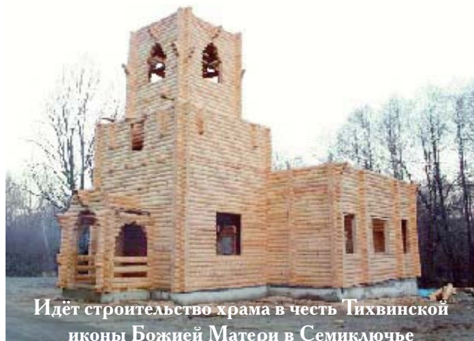
Идёт строительство храма в честь Тихвинской иконы Божией Матери в Семиключье

Подворье монастыря располагается в знаменитом для Пензенской епархии святом месте - в Шемышейском районе, на Семиключье. Работы здесь ещё очень много, но они идут, и идут целенаправленно. Возле святых источников будет стоять большой деревянный храм, который освятят во имя Тихвинской иконы Божией Матери и святого благоверного князя Александра Невского. На этом снимке видно, что сруб уже стоит, нет ещё купола, не сделаны полы, но в скором времени с Божьей помощью всё должно управиться. Планируется построить здесь и небольшой дом для приезжающих паломников, где они могли бы передохнуть, выпить чаю. Уже сделан монолитный фундамент для этого дома.