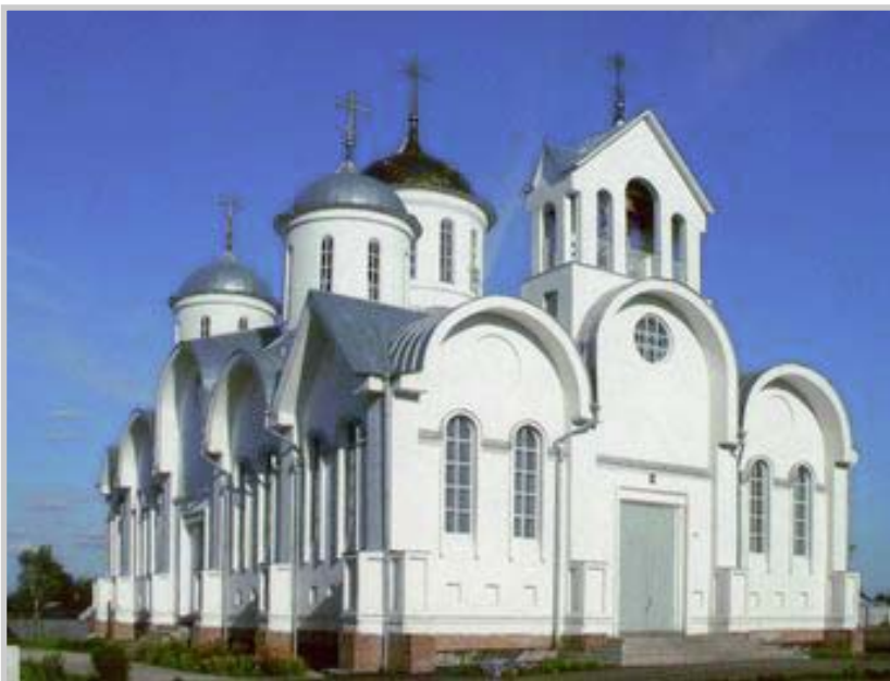
Храм Рождества Христова в Земетчино

- Этот храм мы строили всем миром практически с нуля. В 1992 г. верующим рабочего посёлка передали бывший Дом пионеров - низенький и маловместительный. Начали молиться в нём, но сразу же задалась целью и попросили у Господа помощи построить настоящий, большой вместительный храм. Работы начались в 1994 году, а в 2002-м уже начали в нём служить. Крупных благотворителей не было, средства собирали по копеечке. Трудностей было очень много. Но люди у нас живут, слава Богу, благочестивые, боголюбивые, они искренне хотели, чтобы был настоящий храм, и горячо об этом молились. Если бы прихожане не вкладывали душу в этот храм, не помогали бы - конечно, храма бы не было. А вот теперь он есть, радует нас, на воскресные службы