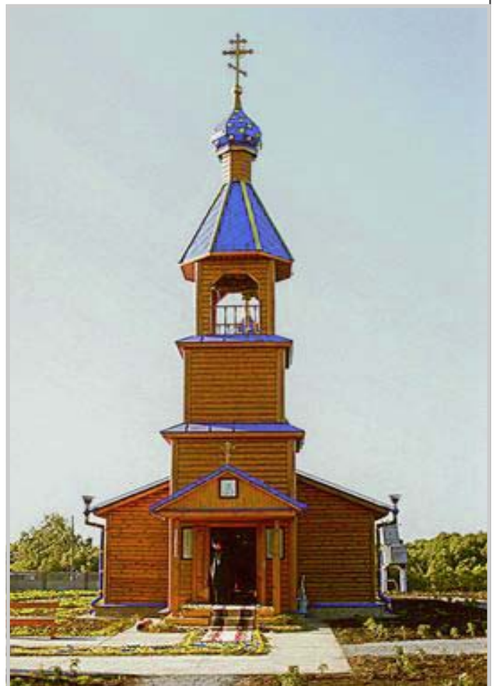
Храм Архистратига Божия Михаила в селе Баранчевка Спасского района