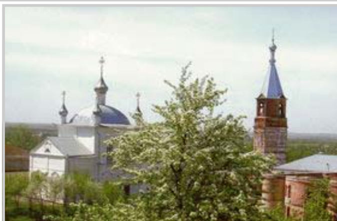
Керенский Тихвинский монастырь, г. Вадинск