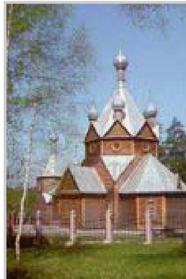
Никольский храм в Ахунах