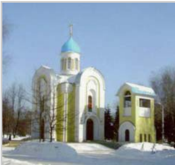
Михайло-Архангельский храм в Пензе