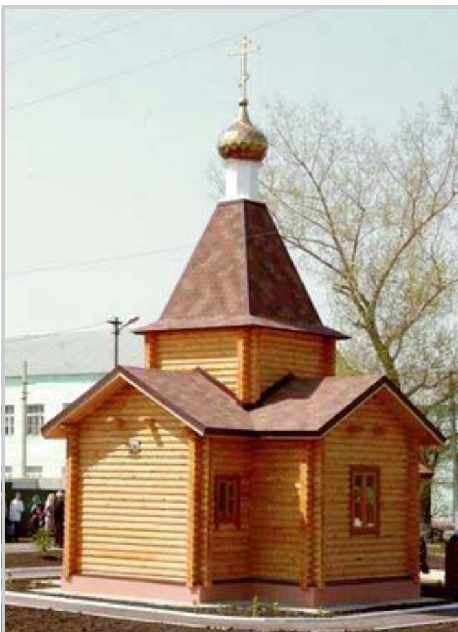
Храм-часовня во имя святого великомученика Георгия Победоносца в районном центре Бессоновка