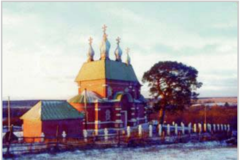
Богоявленский храм в селе Ива Нижнеломовского района, на родине губернатора Пензенской области В.К. Бочкарёва

На праздник Покрова Пресвятой Богородицы в 2004 г. в с. Черкасское Кольшлейского района начались богослужения в старинном Покровском храме. Построенный в 1891 г. усилиями дворян-благотворителей, красавец-храм в 1932 г. был закрыт, новая безбожная власть сделала из него зернохранилище. И только спустя 72 года храм вновь стал местом молитвы: для этого много потрудился бывший председатель Законодательного Собрания Пензенской области и бывший де-