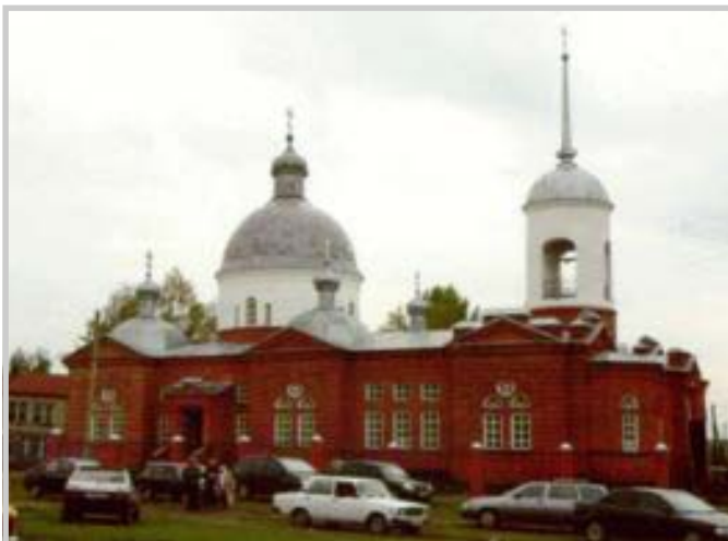
Церковь святителя и чудотворца Николая в селе Поим Белинского района