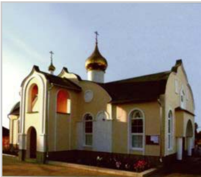
Храм преподобного Сергия Радонежского в Саловке Пензенского района