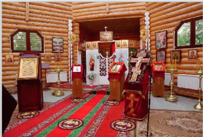
Общий вид нового храма во имя Благовещения Пресвятой Богородицы