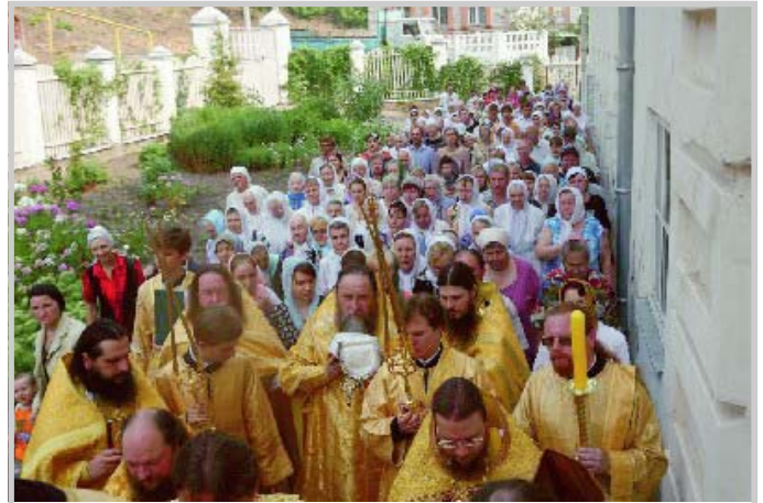
Крестный ход во время освящения храма.

- Святейший Патриарх Кирилл и Священный Синод Русской Православной Церкви благословили возобновить монашескую жизнь в этом святом месте. Как сказал сейчас отец наместник, здесь зажглась свеча молитвы и лампада нашей души к Богу. И Вам, отец Нестор, благословение Божие быть первым наместником возрождённого монастыря. Труден и тернист путь в Царствие Небесное. А Вы должны пройти этот путь сами и вместе с Вами, видя пример Вашего подвига и молитвы, этот путь должна проделать и братия обители, и верующие люди. Пусть эта обитель всегда будет убежищем для больных, страждущих, для укрепления в вере. Я желаю, чтобы Вы и все иноки этой обители несли свой крест с достоинством и честью. Здесь в основном братия из Николо-Угрешского монастыря, и я хотел бы, чтобы тот дух братского созидания, труда и молитвы передался сюда, в нашу Преображенскую обитель. Я поздравляю всех с освящением обители и надеюсь, что 19 августа, в праздник Преображения Господня, мы все будем молиться здесь и