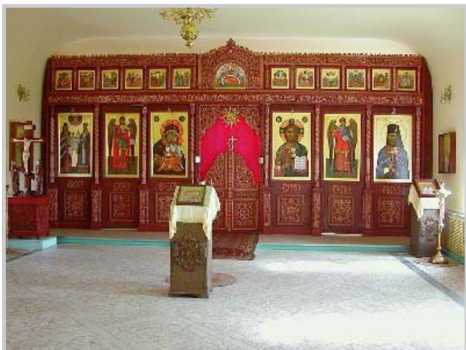
В домовом храме училища.