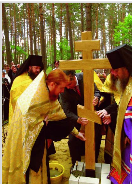
Постановка креста на месте строительства храма

- Сегодня совершилось особое торжество, возможно, не все даже осознают, что же именно произошло сейчас. Сегодня освящён крест и освящено место строительства нового храма в вашем городе - в честь Воскресения Христова. Если храм Христа Спасителя в Москве был воздвигнут в честь победы русского воинства над Наполеоном, то этот храм будет построен в память победы над всякими нестроениями, над всякими проблемами, которые мы пережили и в которых явились победителями. Ваш прекрасный город сейчас полу-