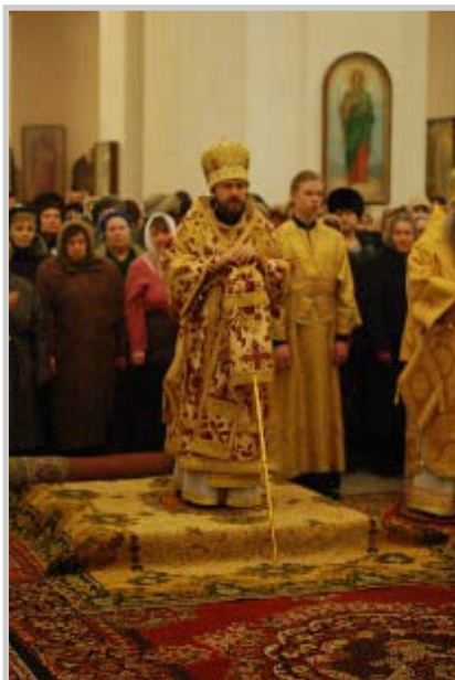
Владыка Иларион обращается с проповедью к молящимся в Петропавловском храме г. Пензы

Этот евангельский рассказ говорит нам о многом. Прежде всего о том, что никакое дело невозможно без помощи Божией. Можно целую ночь ловить рыбу и ничего не поймать, а если Господь захочет, можно поймать столько, что сеть начнёт прорываться. Так происходит со многими чело-