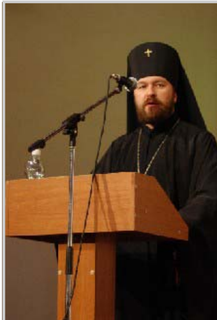
Выступает Владыка Иларион

- Молодёжное движение в Русской Православной Церкви сегодня существует в разных формах. Есть молодёжное движение, которое не оформлено ни в какие институты и организации. Это, прежде всего, движение очень многих молодых людей навстречу Православной Церкви. Очень важно строить мосты, которые бы соединяли Церковь с внецерковным обществом, с окружающим миром и которые помогали бы молодому человеку преодолевать барьеры, отделяющие его от мира Церкви. Ведь в Православной Церкви есть всё необходимое для духовной жизни человека. Но человек может по настоящему пользоваться этим духовным богатством только в том случае, если он уже является членом Церкви. А вот как помочь людям, которые не являются членами Церкви, преодолеть те духовные, психологические, языковые и иные барьеры, которые отделяют человека от Церкви? И вот здесь, мне кажется, Церковь должна и может делать гораздо больше. Прежде всего, мы должны лучше уметь объяснять наше богослужение верующим. И это связано не только с проблемой церковнославянского языка, который не понятен или не вполне понятен, во всяком случае, для человека, приходящего с улицы. Но это связано с тем, что всё богослужение в Православной Церкви создавалось тогда, когда люди жили совершенно иными идеалами, обладали совершенно иными знаниями. Мы Великим постом читаем на первой седмице Великий покаянный канон преподобного Андрея Критского. Это замечательное по своему произведению, где упомяну-