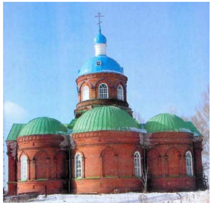
Храм в честь Введения во храм Пресвятой Богородицы в Пензе (Весёловка). Построен в 1906 году. Главный престол посвящён Введению во храм Пресвятой Богородицы, правый придел – святителю и чудотворцу Николаю, левый – Успению Божией Матери.