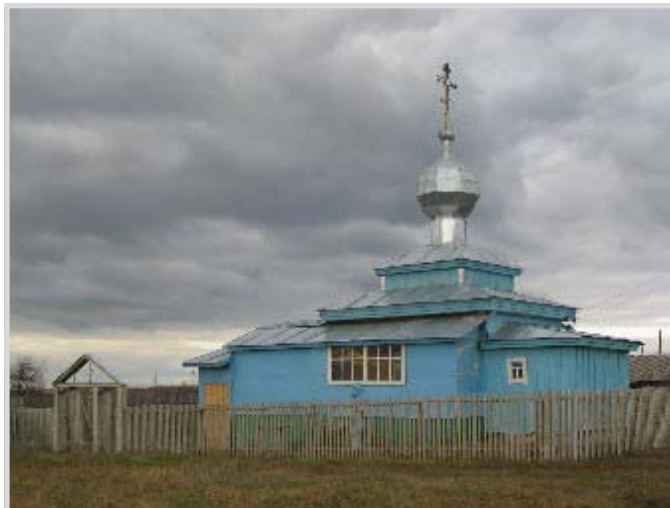
Храм-часовня во имя св. Гавриила Мелекесского в с. Сосновка Сосновоборского района Пензенской области.

Какие ещё испытания предстоит нам пережить? Об этом мы не должны никогда забывать. И в то же время должны помнить о силе, которую Господь дал Своей Церкви от древних апостольских времён до наших, до близких к нам святых, например, преподобноисповедника Гавриила, который был нашим современником и отошёл ко Господу в 1959 году. Всей Церкви Господь дал власть над бесами, всем уверовавшим в Него и крестившимся во имя Его.