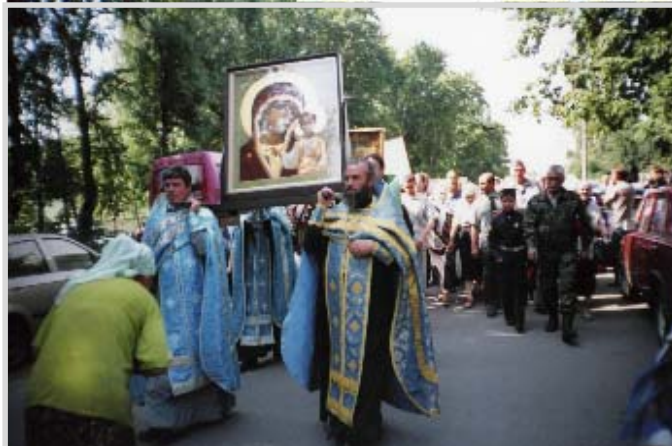
Крестный ход на улицах Пензы