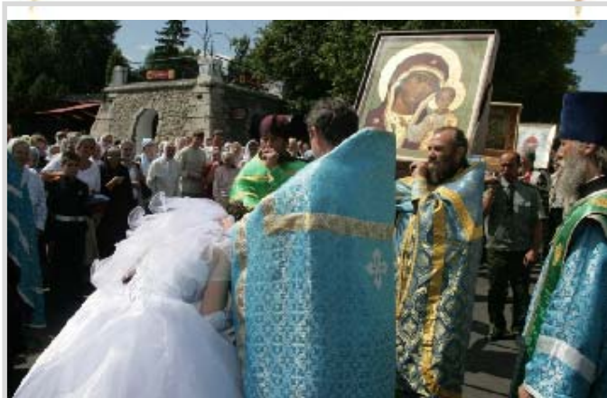
Под иконами крестного хода проходят новобращенные