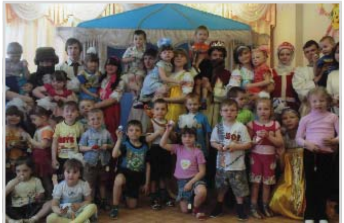
На празднике в социальном детском садике

Ещё один адрес служения «Благовеста» – приют для детей-сирот от 3 до 7 лет на улице Литвинова. Здесь также находятся дети, у которых есть мама и папа, но они лишены родительских прав. Как правило, их сюда переводят из больницы на Бекешской, и пока решается их судьба, куда их определяют – в детдом или в приёмную семью – они живут здесь. И живут хорошо: у приюта есть спонсоры. Члены «Благовеста» вместе с молодёжным православным обществом здесь так же, как и в социаль-