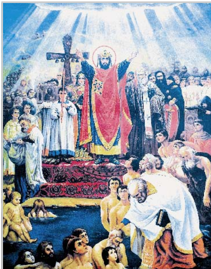
Святой Владимир крестит киевлян. Фрагмент стеной росписи Владимирского собора в Киеве (художник В. М. Васнецов)

«Повесть временных лет» преподовного НЕСТОРА Летописца, 1-я половина XII века