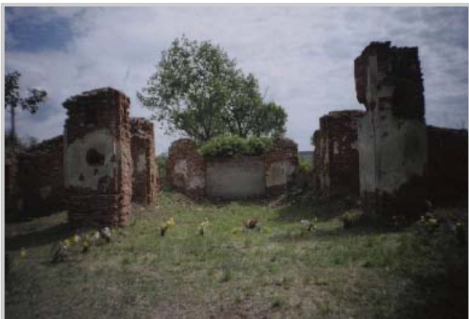
Здесь был алтарь храма

Без малого сто лет радовал жителей Борисовки красавец-храм. Но... в 30-е годы прошлого века его безжалостно разрушили. Село переименовали, веру в Бога запретили. И прошло более 70 лет, пока у жителей Ленино – села по-прежнему большого – не возникло желание покаяться в содеянном. Взяв в Пензенской епархии благословение, начали собирать деньги на установку креста.