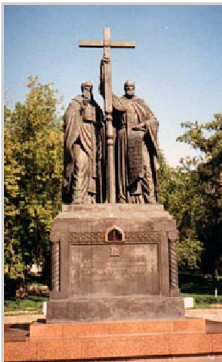
Памятник святым братьям Кириллу и Мефодию на Славянской площади г. Москвы

Преддверием этого пути стала деятельность двух родных братьев Кирилла и Мефодия, которые происходили из греческого города Солоники, бывшего по тому времени вторым по значению после Константинополя. Их жизнь и труды приходились на 9-й век. Оба они, получив прекрасное образование, стали известными в Константинополе людьми. Кирилл, обладая энциклопедическими знаниями и мудростью философа, на-