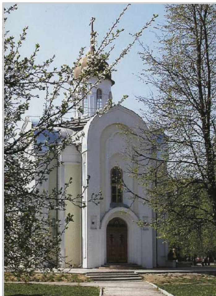
Храм-часовня Архистратига Божия Михаила в Пензе. Настоятель – протоиерей Иоанн Кисняшкин