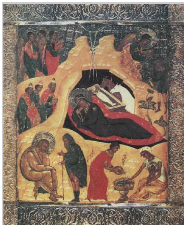
Икона Рождества Христова. 60-е годы XVI века, Благовещенский собор Московского Кремля

Исполнением долгожданной надежды в прошедшем 2007 году стало поистине эпохальное собы-