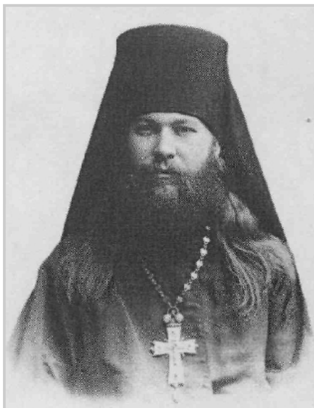
Ректор Пензенской Духовной семинарии архимандрит НИКОЛАЙ (Орлов)

В разгар смуты на должность ректора семинарии и был назначен архимандрит Николай (Орлов), всю свою жизнь посвятивший духовному воспитанию юно-