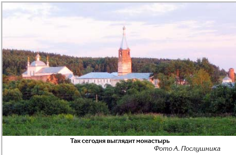
Так сегодня выглядит монастырь