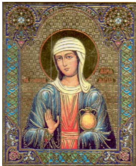
Святая равноапостольная Мария Магдалина – одна из жен-мироносиц

Среди них Мария Магдалина, первомученица Фекла, Мария Египетская, великомученицы Варвара и Екатерина, греческая царица Елена, Анастасия Узоразрешительница, мученица Татиана, Нина Иверская, царица грузинская Тамара, и наши русские – великая княгиня Ольга, Евфросиния Полоцкая, княгиня Феврония Муромская, Анна Кашинская, Евфросиния Московская, блаженная Ксения Петербургская, царица Александра, преподобномученица великая княгиня Елизавета Алапавская... А сколько русских женщин в 20-м веке, в годы богоборчества в нашей стране, ревностно защищали от закрытия и ограбления наши храмы и обители! Какую жертвенную помощь они оказывали преследуемым архиереям, священникам не только в их служении, но и в тюрьмах, в местах заключения. Это они, по словам Святейшего Патриарха Тихона, «белые платочки» – своими искренними молитвами и помощью спасали многие жизни духовенства в те тяжёлые для Церкви времена. Это они в те годы родили и воспитали в христианской вере детей и внуков, которые впоследствии стали епископами,