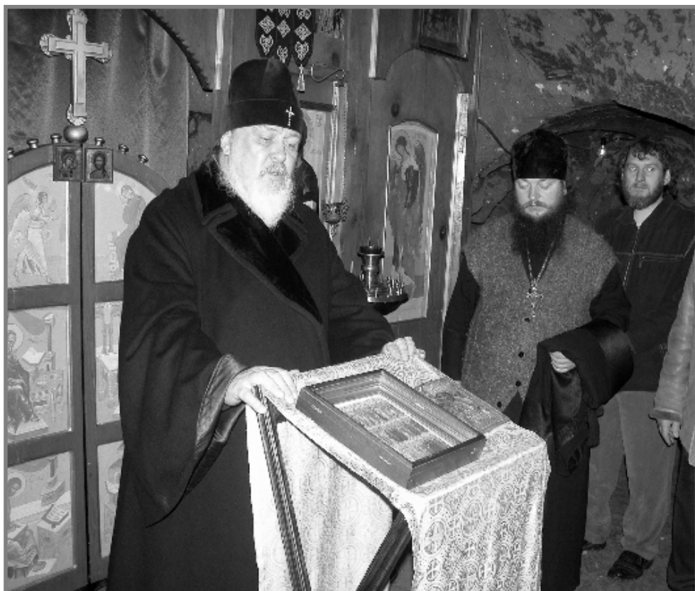
Владыка Филарет и игумен Митрофан в подземной церкви во имя Николая Чудотворца

И вот знаменательное событие: сюда, в восстанавливаемую пустынь, в это святое место, столь любимое народом, прибыл 20 января Владыка ФИЛАРЕТ с духовенством для совершения Божественной Литургии в храме-часовне в честь Казанской иконы Божией Матери. В своём слове к участникам богослужения Владыка отметил, что здесь особенно благостно, легко молиться, воочию убеждаешься в том, что это место – святое. Владыка высказал уверенность, что традиции русского монашества, благотворительности живы и сегодня, что найдутся и уже находятся люди, которые своими добровольными пожертвованиями на восстановление пустыни будут собирать себе нетленные сокровища, которые послужат ко спасению их душ в будущей вечной жизни.