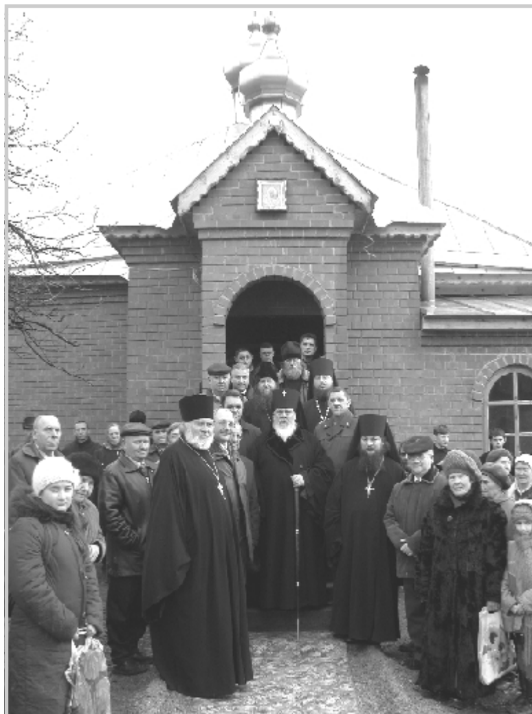
Участники богослужения у храма - часовни в честь Казанской иконы Божией матери