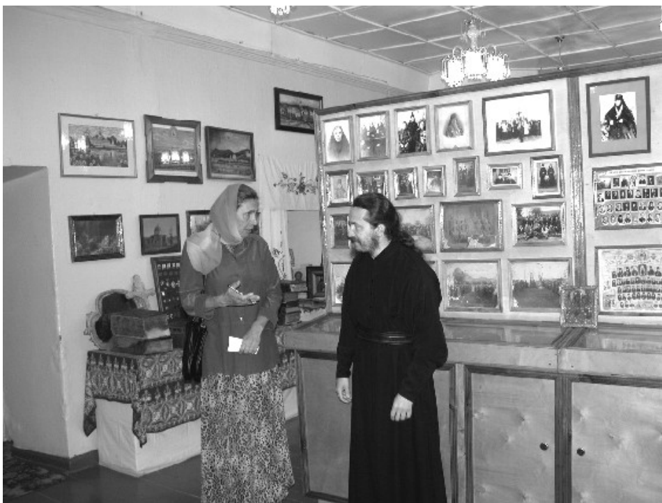
В одном из залов церковно-исторического музея Свято-Тихвинского Вадинского (Керенского) мужского монастыря.

Большое всем спасибо от нас и от наших подопечных!