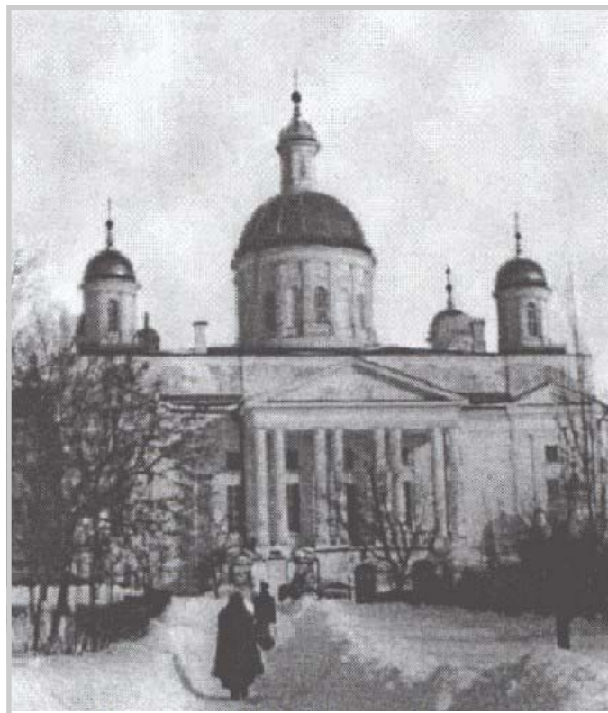
Южный фасад собора, начало XX века

В 1836 году собор удостоился своим Высочайшим посещением Его Величество государь император Николай I, а в следующем 1837 году – Его Высочество наследник цесаревич Александр