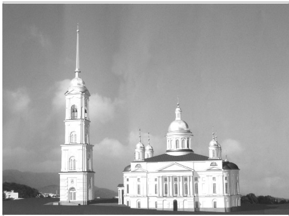
Таким будет воссозданный Спасский кафедральный собор