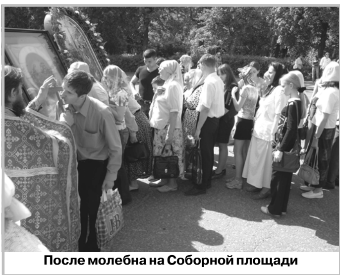
После молебна на Соборной площади

Материалы полосы подготовил Николай СЕМЯЧКОВ