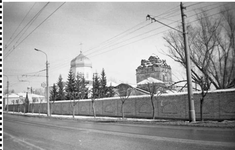
Троицкий женский монастырь в Пензе. Здесь действует Духосошестввенская церковь, храм Св. Троицы – в стадии восстановления. Настоятельница монастыря – игуменья Митрофания (Перетягина).