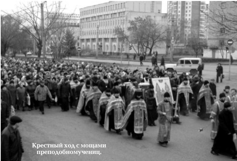
Крестный ход с мощами преподобномучениц.