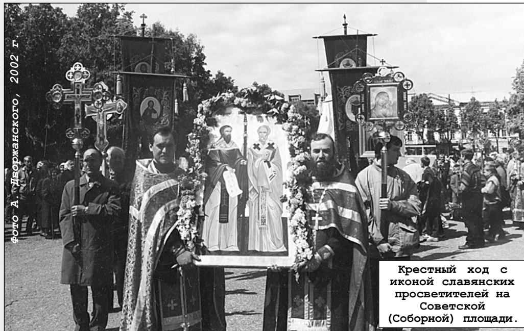
Крестный ход с иконой славянских просветителей на Советской (Соборной) площади.

Наша многопрофильная гимназия №13 недавно получила как награду во Всероссийском конкурсе Интернет-образования три мультимедийных комплекта о жизни и подвижнической деятельности Мефодия и Кирилла. Теперь мы можем более предметно раскрывать перед учениками огромное значение подвига просветителей славянских народов.