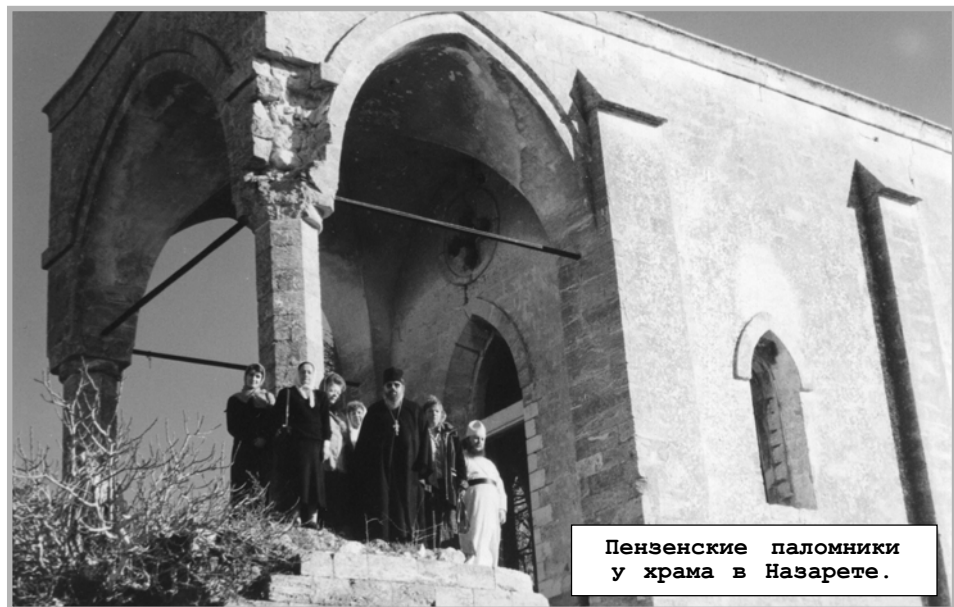
Пензенские паломники у храма в Назарете.

сего. То есть, за благотворителей из Пензы, за всех пензенцев идет на Святой Земле молитва.