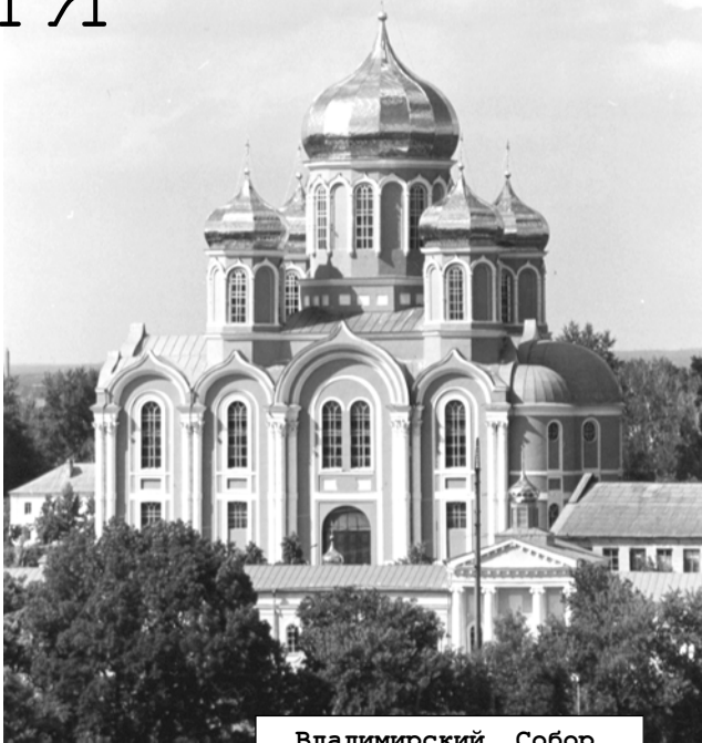
Владимирский Собор Задонского монастыря. Здесь лежат мощи свт. Тихона.

В уединении он ревностно предавался подвигам иноческой жизни. Ночи он проводил без сна и ложился на рассвете. Упражнениями его в ночное время были молитвы с поклонами, притом не холодные, а самые горячие.